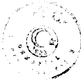
Ayşe DONBALOĞLU Uzman