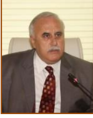
Nuh KARA İL Genel Meclis Başkanı